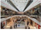
el centro comercial