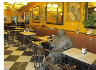
el café/ la cafetería